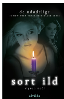
Bind 4 · Forår 2011