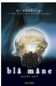
Bind 2 · Er udkommet