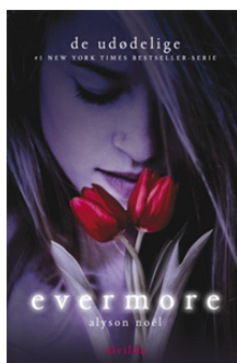
Bind 1 · Er udkommet

Der er planlagt i alt seks bind i serien om De udødelige . Serien afsluttes i 2011.